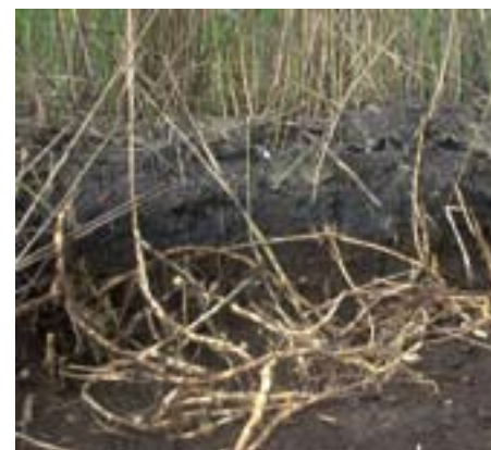
► Zicht op de doorsnede van het ontwaterd slib met de wortels van de rietplanten (rhizomen)

De secundaire belasting van de zuiveringsinstallatie door filtraatwater is tegenover conventionele ontwateringstechnieken belangrijk lager. Het is bovendien mogelijk om de slibontwatering het gehele jaar door plaats te laten vinden. Na ruiming kan een deelbekken weer in gebruik genomen worden, zonder dat arbeidsintensief herplanten van het riet nodig is: de rietplanten ontwikkelen zich namelijk telkens opnieuw vanuit de diepliggende rhizomen. De ruimingsfrequentie is afhankelijk van de installatie en wordt bepaald door de bassindiepte. Het nacomposteren van het verarde slib kan in of buiten de bassins plaatsvinden. Het tijdstip van ruiming is flexibel te kiezen. Het eindproduct wordt gekenmerkt door een drogestofgehalte van meer dan 40% en de inzet van toeslagstoffen is niet nodig.